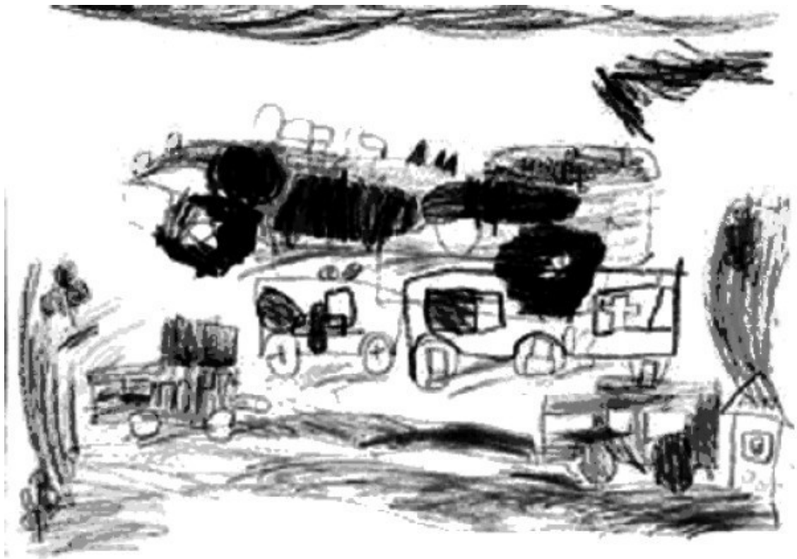
Рис. 5. Война

К пяти годам ребенок уже умеет писать свое имя печатными буквами, в его рисунках появляется очевидный смысл, они носят сюжетный характер. С особым удовольствием пятилетние дети рисуют разных животных, птиц, всевозможные предметы быта, деревья, цветы (рис. 4).