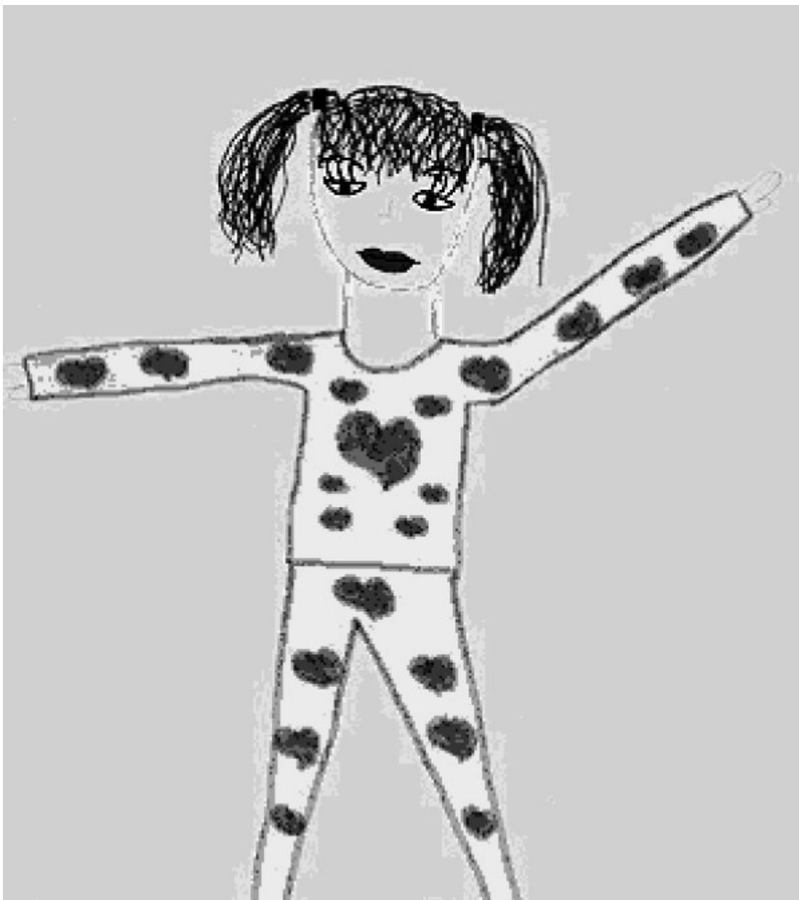
Рис. 6. Девочка в спортивном костюме

В дальнейшем, в возрасте десяти лет, у детей возрастает стремление реалистично отображать в рисунке все увиденное [2].