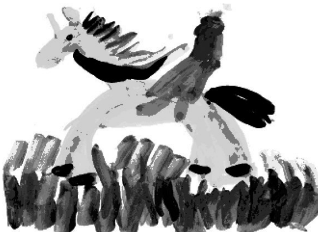
Рис. 4. Лошадка